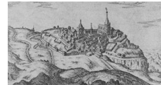
Embrun, 1652, gravure Tassin

Schrijven en ontwerpen: C. Clivio / PAH S.U.D. - Afdrukken: Recto/verso - 2021 editie - Foto- en illustratiekredieten: graphisme 800 ans, R. Ferré; © C. Clivio/Pays S.U.D.; Ville d'Embrun; C. Bertelletti / Archives départementales 05. Vertaling: Erica WORTEL