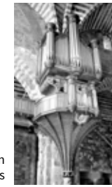
Koorbanken van de apsis

Grote orgels, gerestaureerd door atelier Quoirin