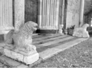
Pórtico del Real, leones estilóforos (soportan una columna)