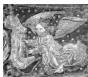
Casulla, siglo XV, detalle, Ciudad de Embrun