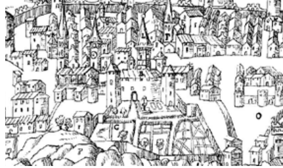
Embrun hacia 1570, Belleforest