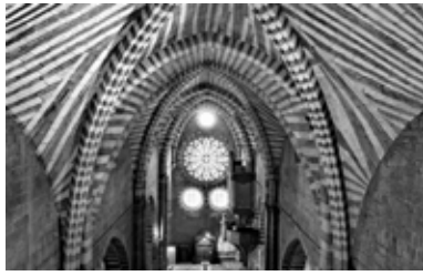
Bóveda de la nave central