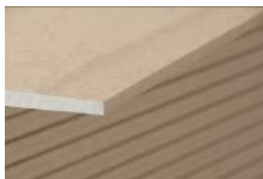
Plaque Crème (Standard)