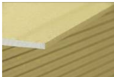
Plaque Jaune (Très haute dureté)