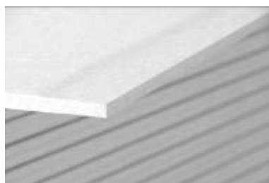
Plaque Blanche (Déco. A1)