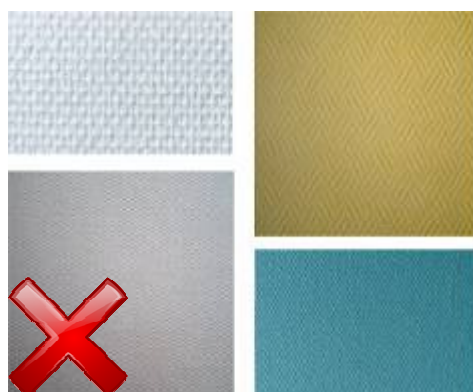
Revêtements fibre de verre (Plaque de plâtre avec revêtement en fibre de verre créant un relief)