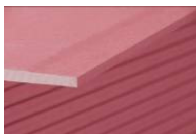
Plaque Rose (Feu)