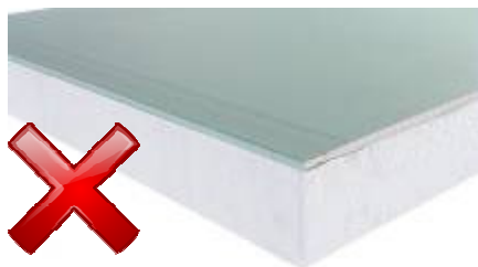
Complexes de doublage (Plaque de plâtre & PSE blanc ou gris)