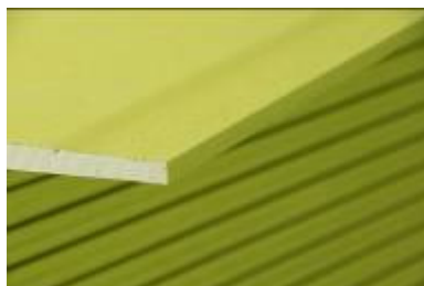
Plaque Verte Anis (Absorption des COV)