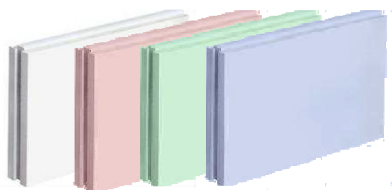
Carreaux blanc, rose, vert, bleu (Standard, feu, locaux humides, acoustique)