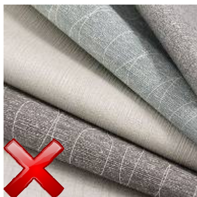
Décoration vinyle (Plaque de plâtre avec revêtement étirable en vinyle)