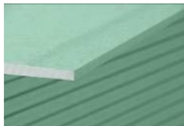
Plaque Verte (Locaux humides)