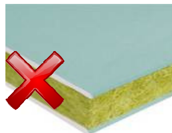
Complexe isolant (Plaques & laine de roche)