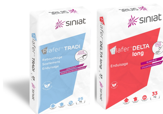
Plâtre en poudre admis sous réserves