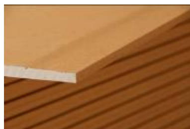
Plaque Orange (Locaux très humides)