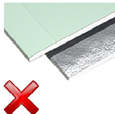
Pare-vapeur (Plaque de plâtre avec revêtement « aluminium » pare vapeur)